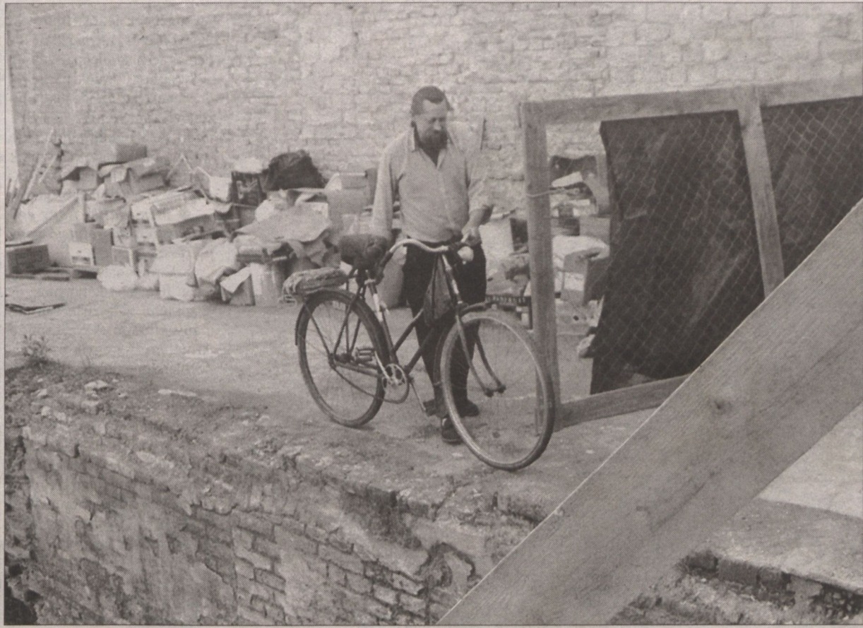
A telek és a hajléktalan is a sorsára vár...

A fölújított bérpaloták tövében, a banknegyed közelében, a színháztól egy ugrásnyira van egy beépítetlen telek. A Takaréktár utcai foghíjtelek az ABN-AMRO Bank tulajdona, de ott egy, papírdobozokból és műanyag fóliából tákolat hajléktalan, sokféle lom között egy férfi él, a kutyáját, de a tűztől is, félnek a dobozokban meghúzódó hajléktalantól, s várják, hogy beépüljön a telek.