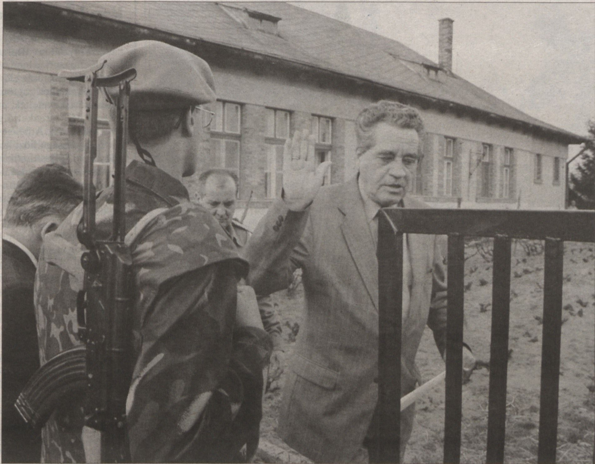
Lányi Zsolt búcsút int a nagyszéksői iskolában táborozó határőröknek.

Lányi Zsolt, a parlament honvédelmi bizottságának elnöke – a testület ülését követően – tegnap délután villámlátogatást tett Csongrád megyében. Mórhalmon a határőrség kirendeltségén tájékozódott, a nagyszéksői általános iskolában táborozó határőröket is meglátogatta, majd a röszkei határátelvonó találkozott a sajtó munkatársaival.