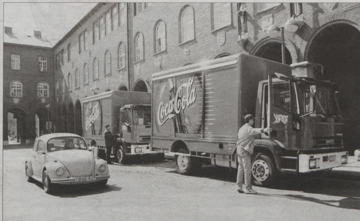
Italszállító-flotta a Dóm téren: harminc kocsit már behajóztak.

Kiskundorozsmát nemcsak a szegedi Csillagbörtön lakói emlegetik egyre sűrűbben, hanem mostanában Palesztinában is megismerhetik a szomjazó emberek. Pontosabban a Tornádó International Kft. gyártmányait immár nemcsak a hazai elítéltek, hanem egy amerikai cég megrendelésére jövők közül – a Közel-Keleten is megismerhetik.