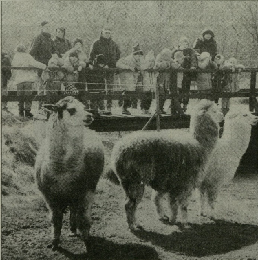
A gyerekek érdeklődve figyelik a dél-amerikai tevék családjába tartozó alpakákat.