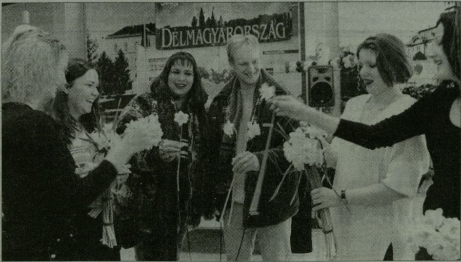
Az ifjú párokat vidám hölgyek köszöntötték...

te Valentin-center hangulatos vására állt, és a vállalkozó kedvű ifjokok éppen zenei kvízzjátékokon vettek részt, vagy mondjuk híres szerelmes filmek címeit igyekeztek kitalálni – csakis igennel válaszolhat e kérdésre. Mert bi-