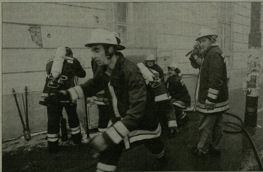
A helyszíre érkező tűzoltók tíz perc alatt eloltották a tüzet.