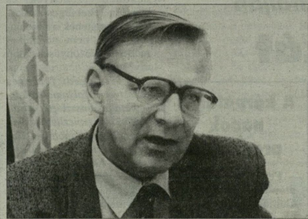
„A lelkesedés jellemző a diákköri mozgalomban részt vevő tanárok többségére.”

– A diákköri tevékenység az ötvenes évektől napjainkig rendszeres eleme volt a felsőoktatásban folyó munkának, politikai berendezkedéstől függetlenül. A dolgozatokat bemutató rendezvénysorozat a felsőoktatási intézményekben bizonyos tudományterületeken kiemelkedő teljesítményt nyújtó fiatalok seregszemléje. A zsűri által a legjobbnak ítélt munkák továbbjutnak az országos tudományos diákköri konferenciákra, amelyeket az