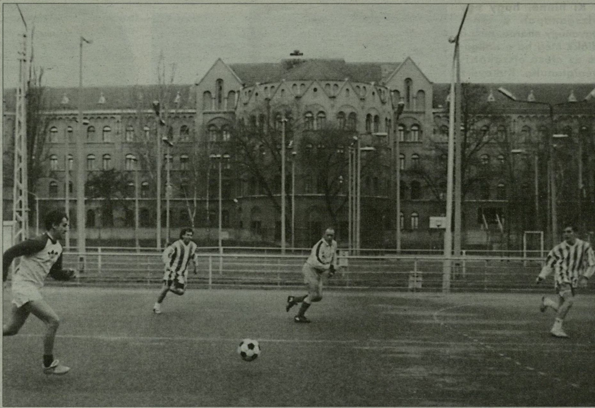
Ady tér. Az utolsókat rúgják...

Az önkormányzat legutóbbi ülésén elfogadták az Ady tér, illetve a Kossuth-laktanya környékére vonatkozó részletes építési szabályozási tervet. Előbbi helyen könyvtárépítést, utóbbin pedig sportcentrumot kíván létrehozni a Szegedi Felsőoktatási Szövetség.