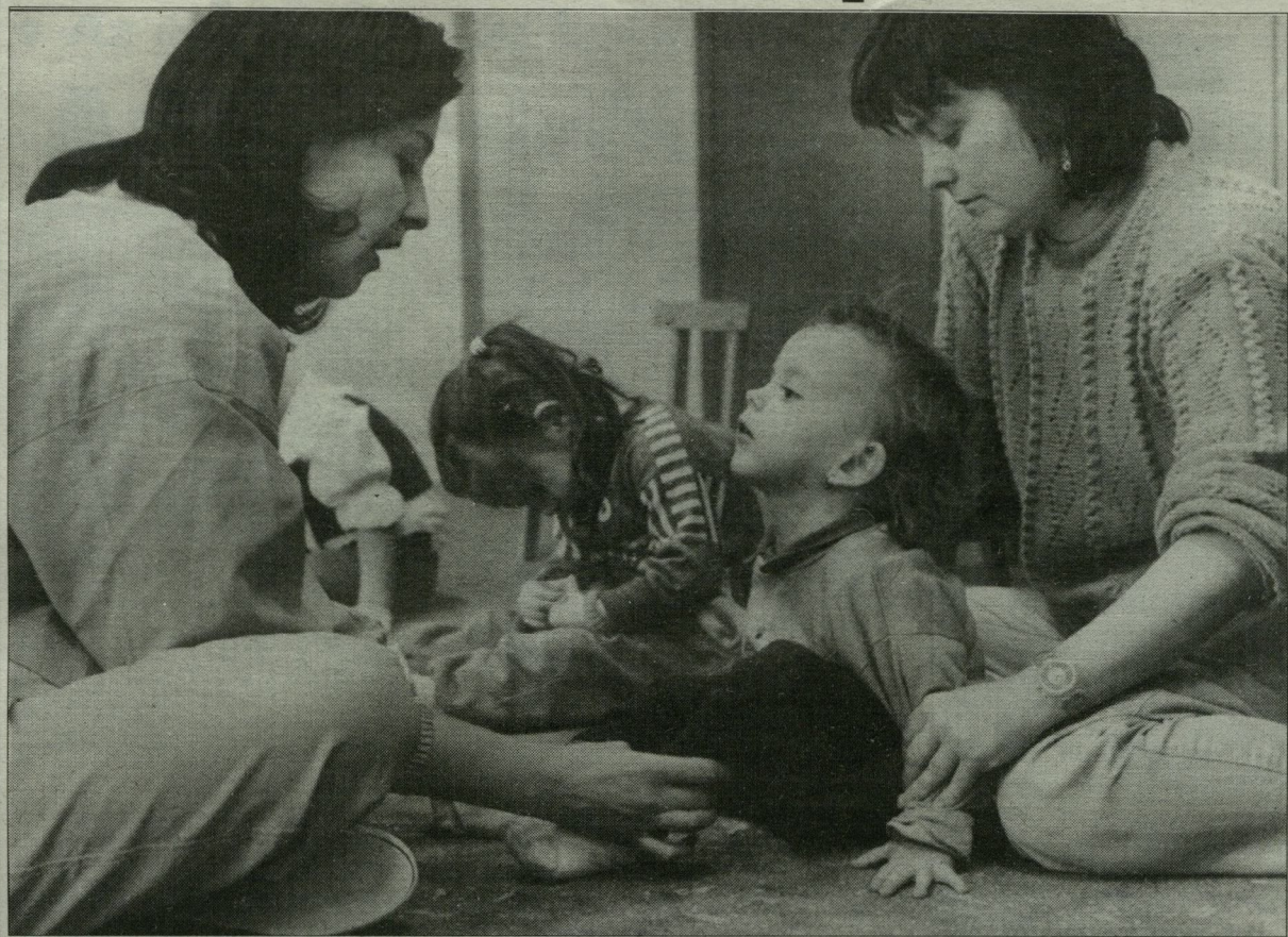
Mozgásfejlesztő óra konduktor vezetésével, szülői közreműködéssel.

Példaértékű és követésre méltó az a kezdeményezés, amit a szegedi Vedres utcai bölcsőde speciális fejlesztő csoportjába járó sérült kisgyermek szülei szerveztek meg. Az általuk létrehozott alapítvány keretein belül olyan szolgálatot működtetnek, amelynek célja az újonnan született fogyatékos gyerekek szüleinek azonnali megsegítése.