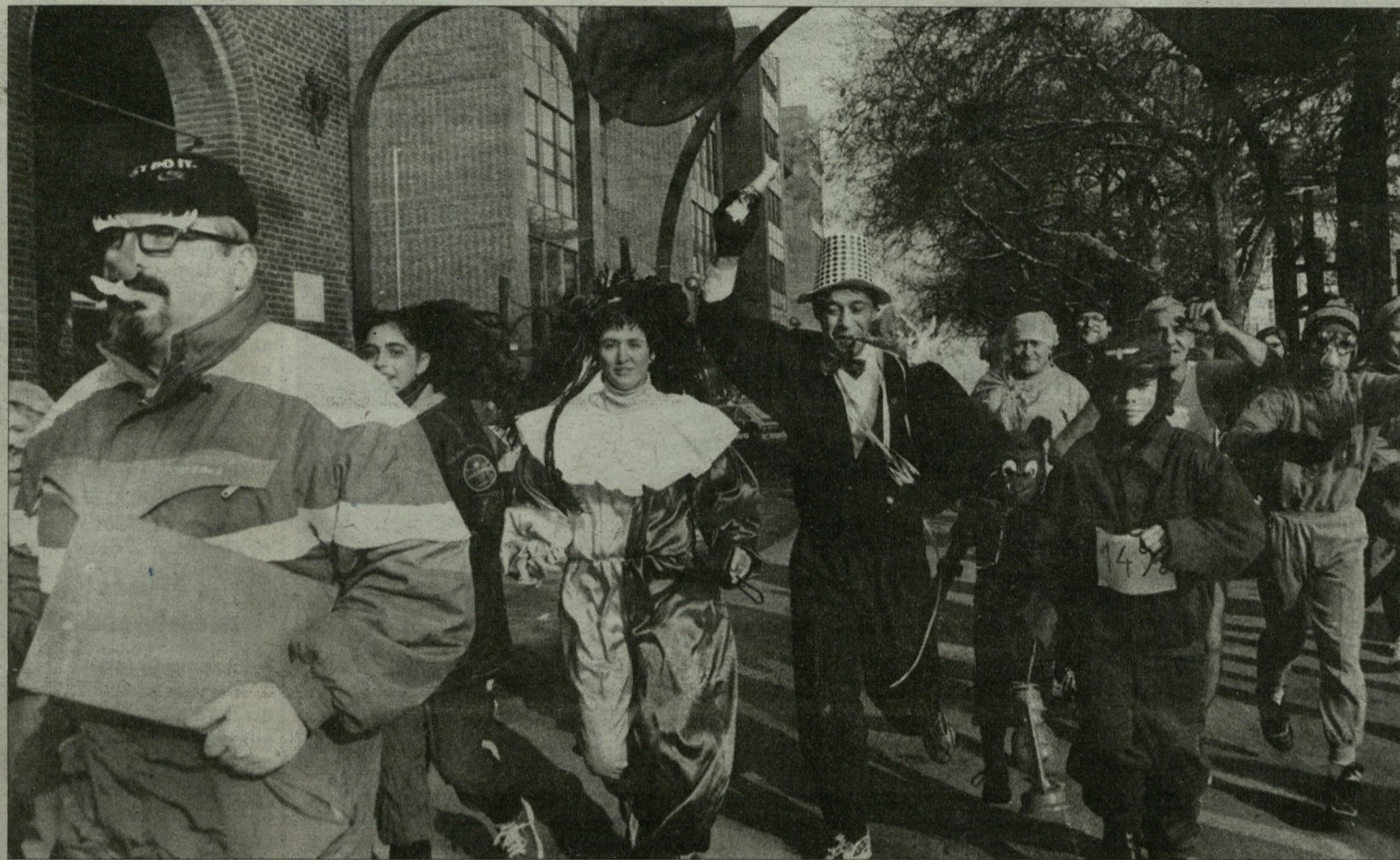
Szegeden már délelőtt 11 órakor „éjféli hangulat” uralkodott – a Dóm téri futófesztiválon.