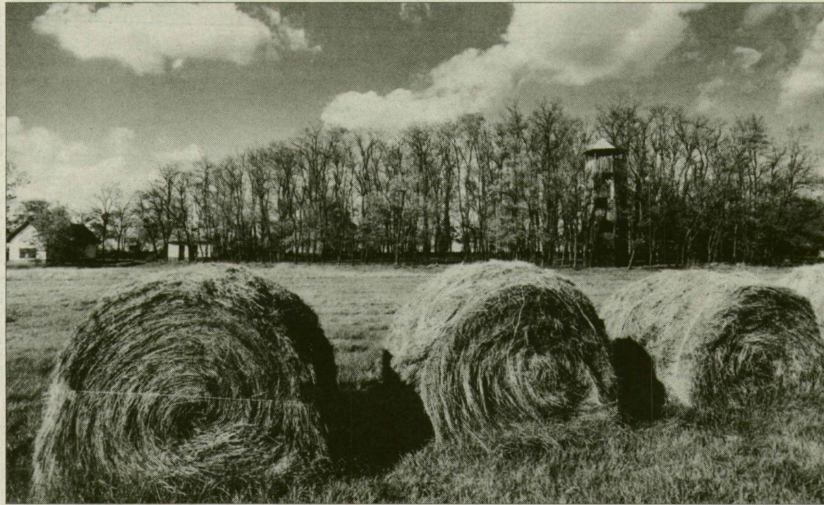
Közel kétszáz hektár – a madaraknak?