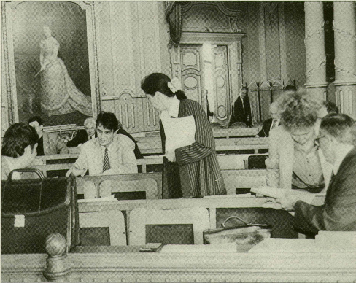
Búcsú, laza hangulatban.

Nem tagadta meg önmagát a szegedi közgyűlés utolsó testületi ülésén sem. Ünnepi emelkedettség nélkül, „apró” milliók ide-oda csoportosításáról vitázva, a város hitelállományát tovább halmozva búcsúztak a képviselők egymástól, s önkormányzati feladatuktól.