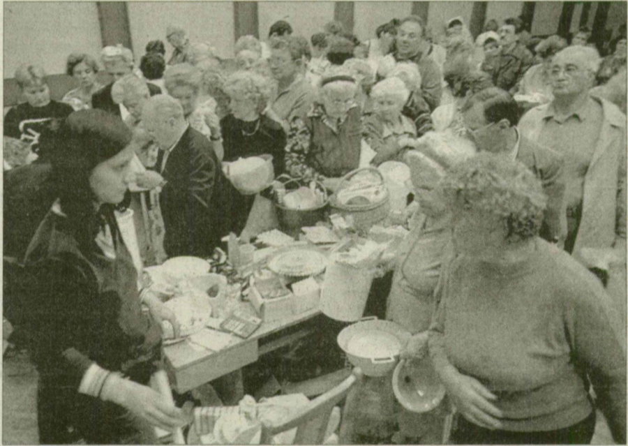
Szatyorszám vásároltak az emberek tálakat és bögréket az akción.

● Munkatársunktól Hosszú sor kígyózott tegnap délelőtt Szegeden, a Vasutas Művelődési Ház bejárata előtt. Egy kiskörös magánvállalkozó óriási áremegemlényel árult különféle konyhafelszereléseket, mosógépeket és zsebkendőket a kultúrház nagytermében. Az emberek képesek voltak akár fél órát is sorban állni, hogy bejussanak „műanyagországba”.