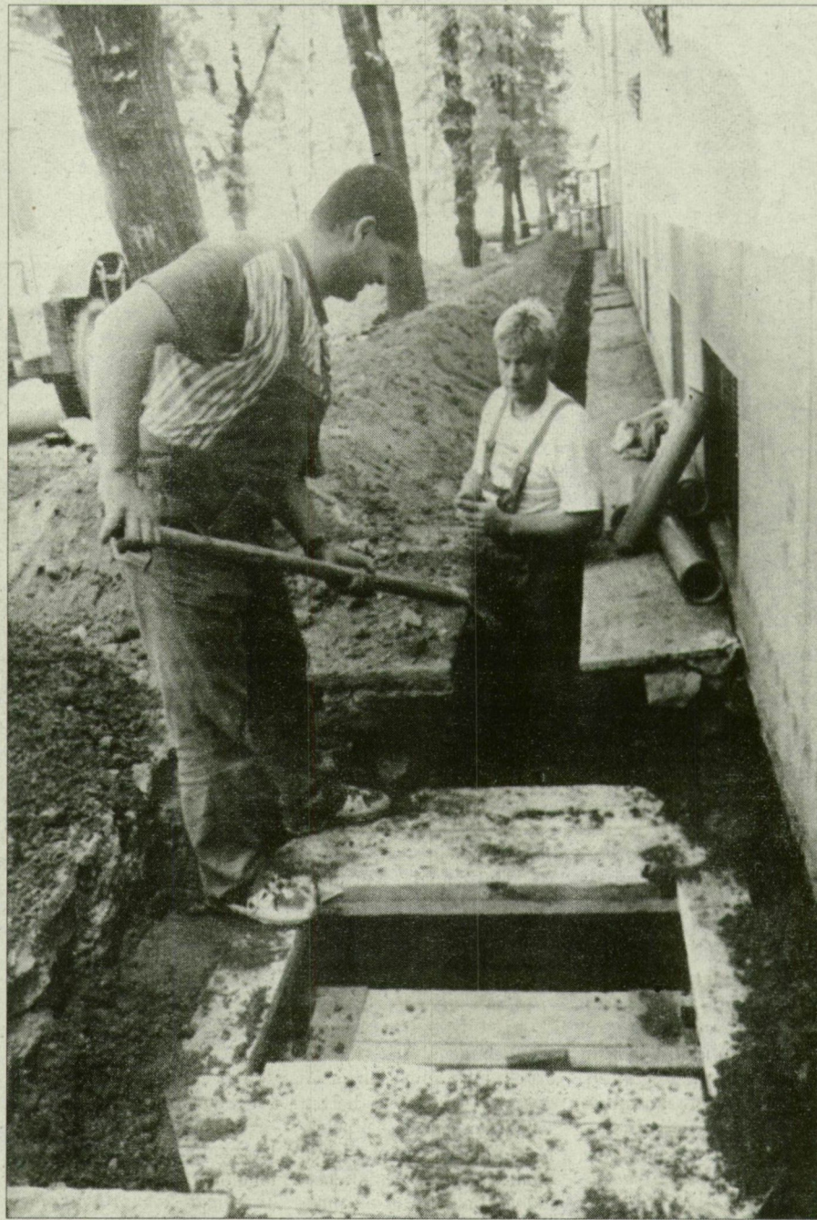
A szorgalmas árkászokat ügyes gépek is segítik a Béke utcában.

A kérdésre - hol is dolgoznak a kábelfektető munkások idei ősziükön, telükön? - nagyon könnyű megadni a választ. Ugyanis Szeged belvárosának gyakorlatilag minden utcáját érintik a munkálatok. Attól persze nem kell tartani - nyugtatja meg Szeged központjának lakóit a Giltek Hungary Kft. menedzsere -, hogy nem marad aszfalt fúratlanul, ugyanis a burkolatbontás és az árkok ásása miatt csak egyes utcaszakaszok forgalmi rendje változik meg. A kiviteli tervekben az is kiolvasható, hogy utcák teljes lezárására, s az ezzel járó forgalom elterelésére nem lesz szükség. Az viszont biztos, hogy a fizetőparkoló egy részét a telefonhálózat-építés idején nem tudják igénybe venni az autósok, ugyanis hiába fekte-