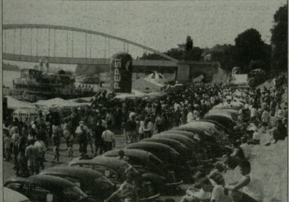
A tavalyi rendezvényre is ezek voltak kíváncsiak. Felvételünk a bogáralakozón készült.