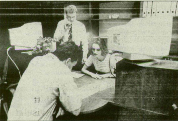
Startra kész iroda. Időt, tehát pénzt takarít meg a vállalkozónak.