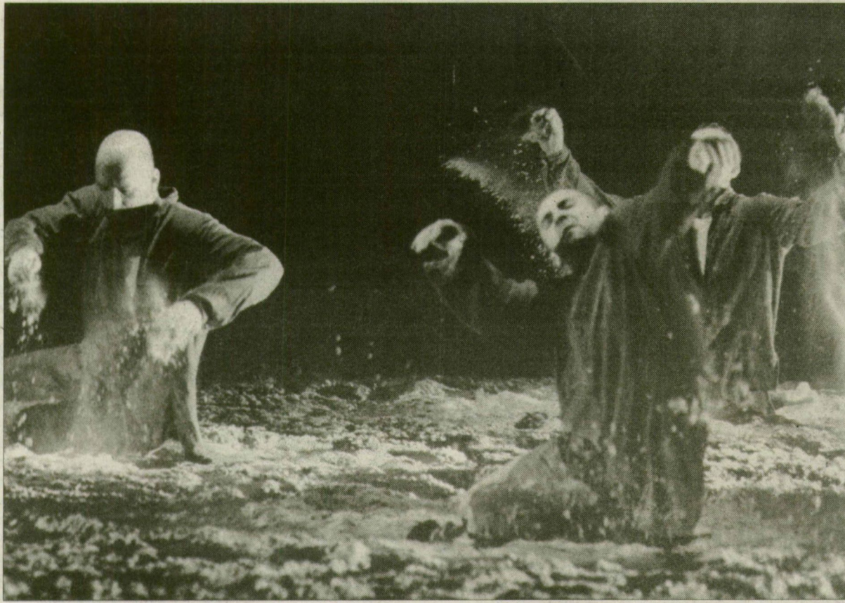
A Kortárs Balett produkciója a britek tetszését is elnyerte.