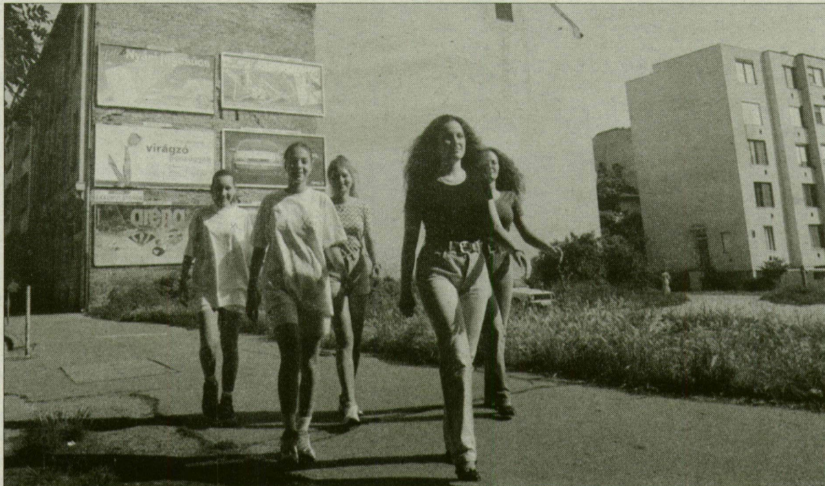
Alku tárgya a Honvéd téri telek. Már látszik a főcsapásirány.

A Szeged Nagyrúháza márpedig fel kell újítani. Ebben a kérdésben egyetértenek a tulajdonosok a város vezetésével, sőt elkészültek a tervek is. A befektetők csapata azonban nehezen áll össze, vagyis pénz hiányában egyelőre csak álmodni lehet a megoldásról.