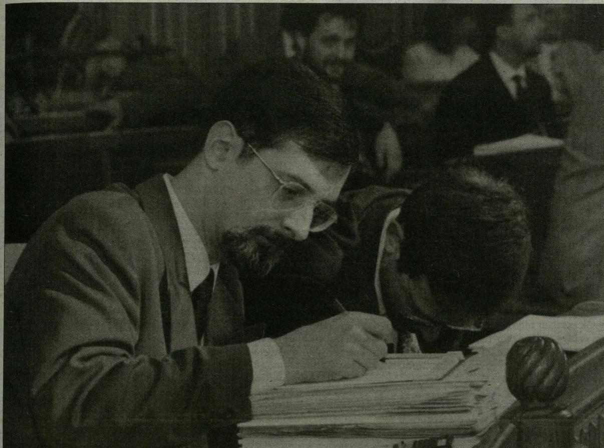
Básthy Gábor lemondó levelét megírta.