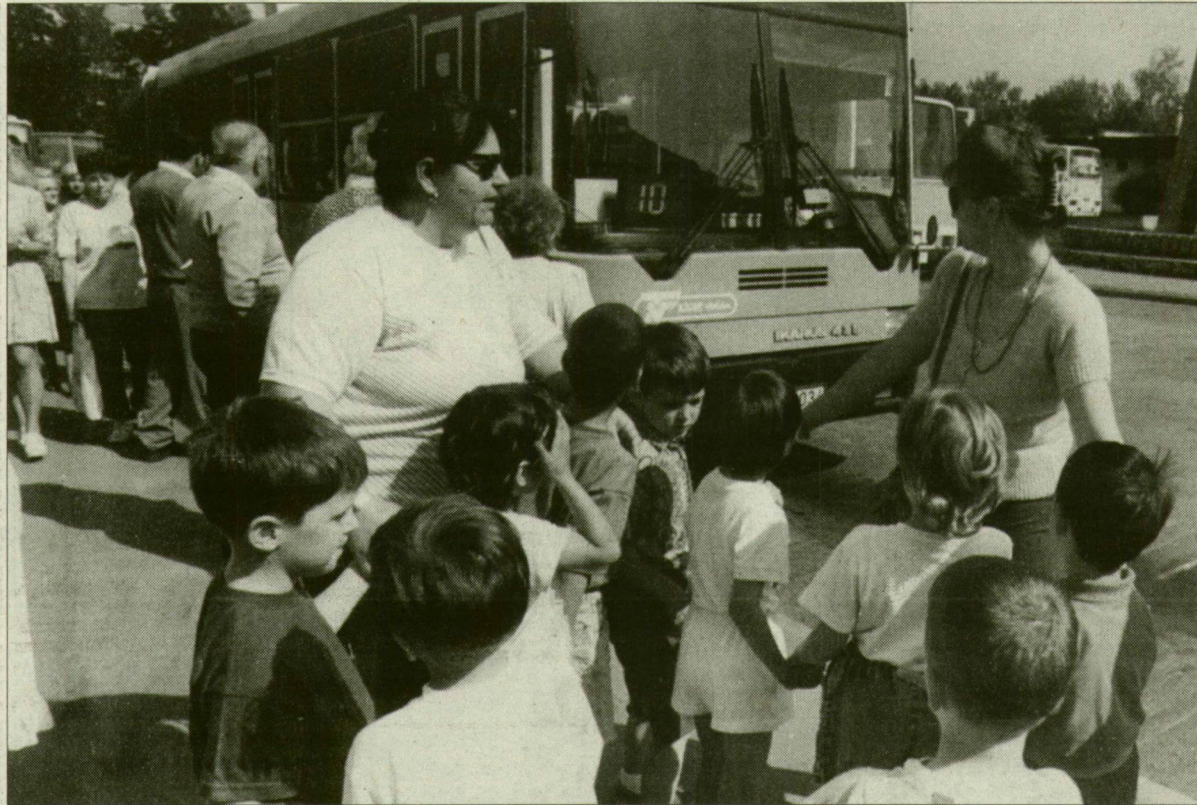
A modern Ikarusra váró gyerekek már el se hinnék, hogy egykoron farmotoros buszok robogtak Tarjánból a belváros felé...

A társaság nettó árbevétele meghaladta a 3 milliárd 834 millió forintot, az adózás előtti nyereség összege elérte a 103 millió forintot, 350 autóbuszok 105 millió utast szállított, míg beruházásokra 561 milliót költöttek. E számok az ország egyik legnagyobb közlekedési társaságának, a Tisza Volán Rt.-nek 1997-ben végzett munkáját jellemzik. S hogy ilyen sikeres év után mit várnak a Volánosok 1998-tól? Ezt vitatták meg tegnap a részvényesek a cég szegedi, Bakay Nándor utcai központjában a társaság évi rendes közgyűlésén.