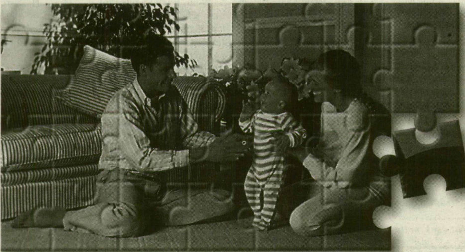
Olcsó, tiszta, kényelmes energia a Dégáztól

Ha régóta vágyik arra, hogy otthonát, üzletét olcsó, tiszta energiával tegye kényelmesebbé, és csak a lehetőségre vár, akkor fontolja meg ajánlatunkat!