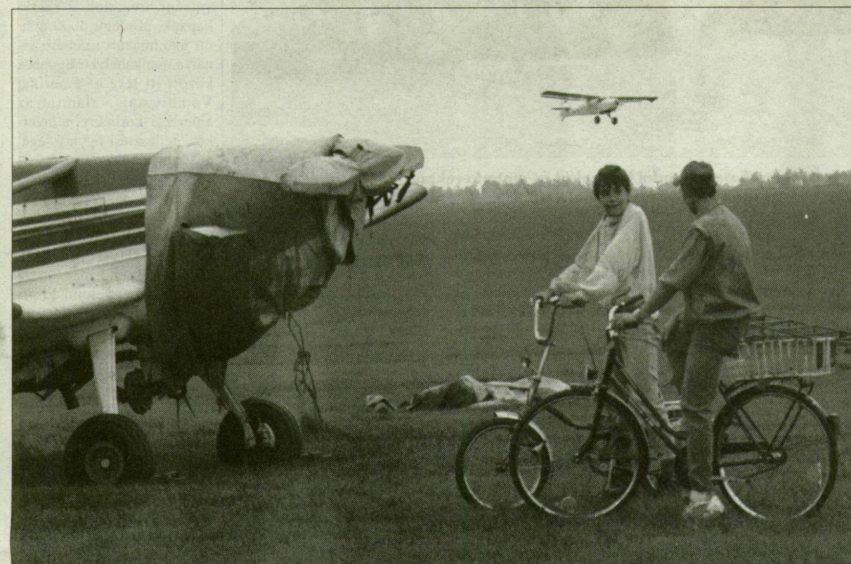
Ki csomagolja be, s adja a városnak a szegedi repülőteret?

Adakozó kedvű a búcsúzó kormány. Térítésmentesen adott ingatlanokat hat települési önkormányzatnak a Honvédelmi Minisztérium – vélhetően a Horn-kormány egyik zászlólevonás előtti döntéseként. Am ebből az ajándékcsomagból Szeged nem részesült.