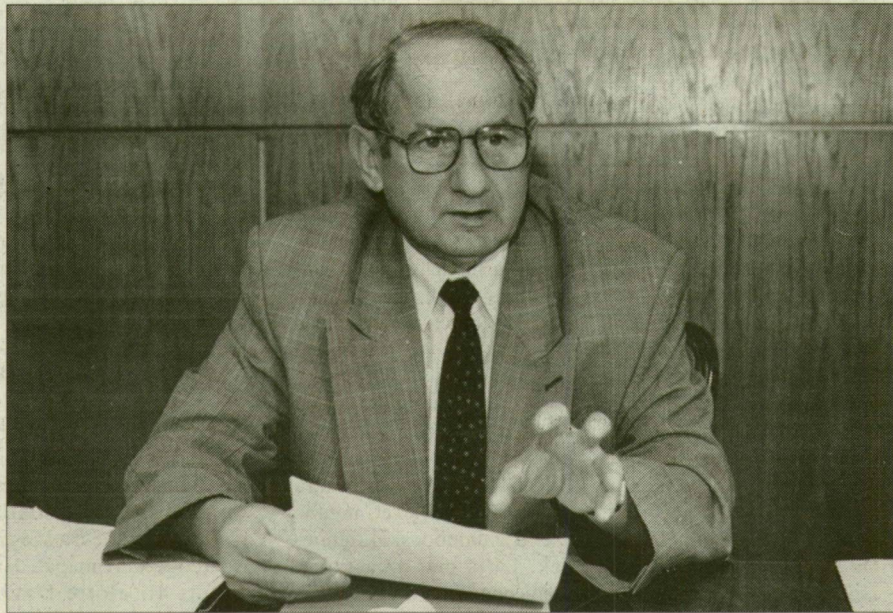
Dr. Mészáros Rezső: „Soha nem egy régió kapcsolódik, hanem annak a meghatározó központja és települései.”

na, Milano) állnak, de őket már azok a városok követik, amelyek az új európai fejlődés központjaiként újultak meg: Utrecht, Augsburg, Graz, Bologna. Manapság egy Szeged nagyságú város sikereit, sorsát többnyire az dönti el, hogy mennyire képes kapcsolódni a nemzetközi termelési és fogyasztási rendszerekhez. Az elmúlt évtized tapasztalata, hogy azok a szerepek, amelyek a városok gazdasági átszervezése, funkcionális bővülése vagy nemzetközivé válása során kialakulnak, meghatározhatják a jövőt. Kell-e ennél biztosabb ars poetica a várospolitikára?