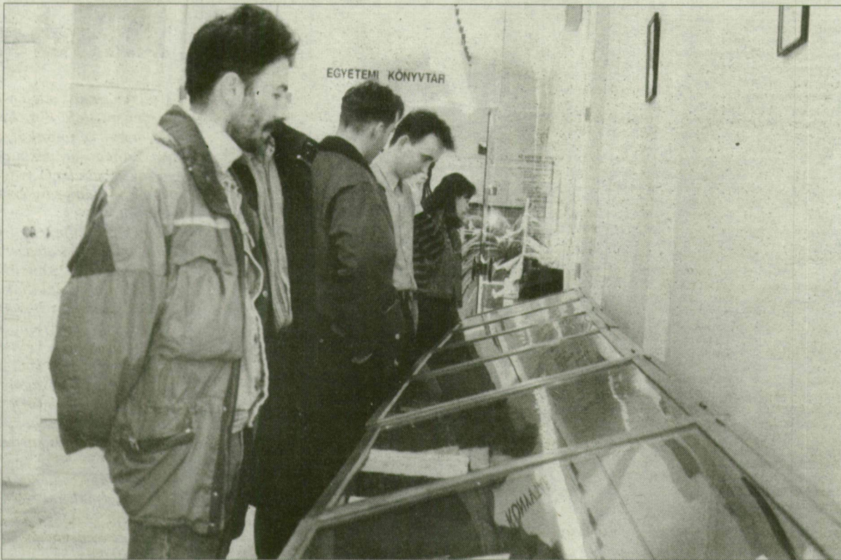
A tárlókban a professzorok életrajzát és műveit mutatják be.