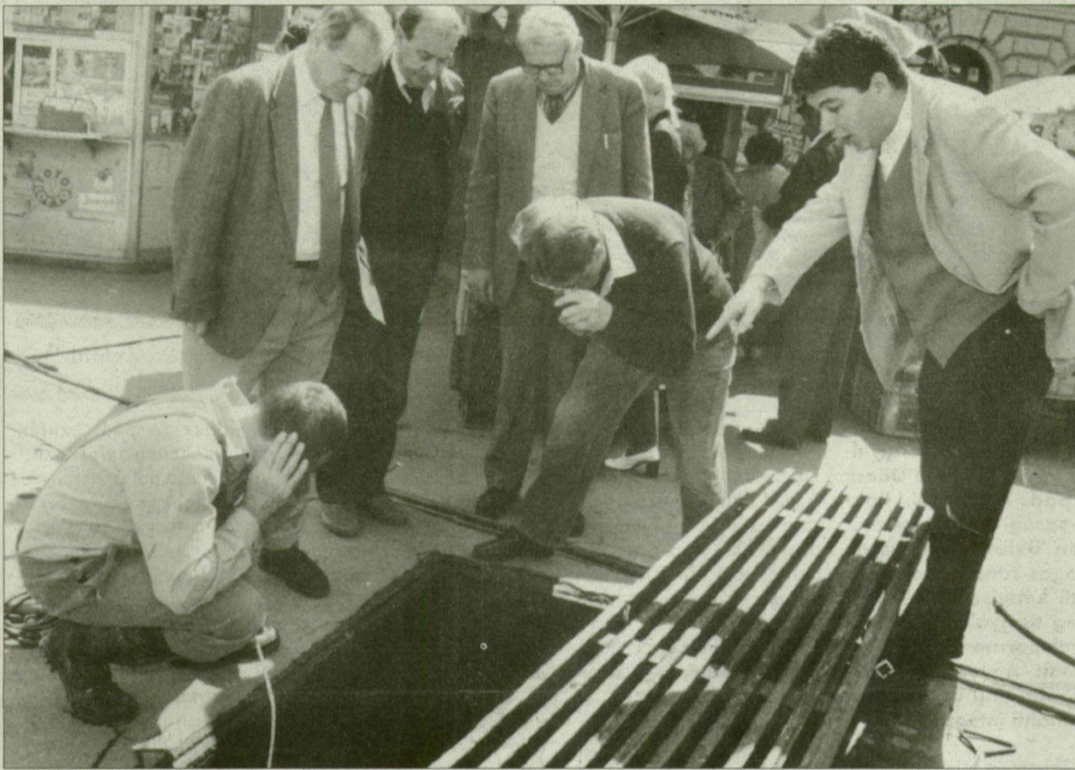
Nem zárják le a kutat, csupán ellenőrzik.

Az Anna Ásványvíz Palackozó Kft. palackozóüzemé alakítja át a gyógy-