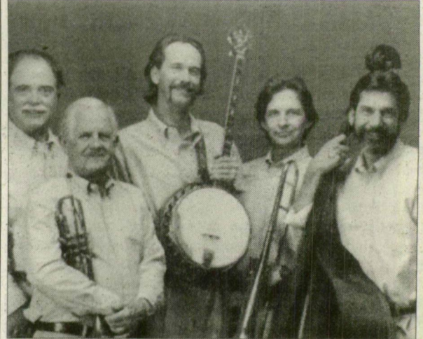
Az Egyesült Államokból érkezik a Port City Jazz Band.