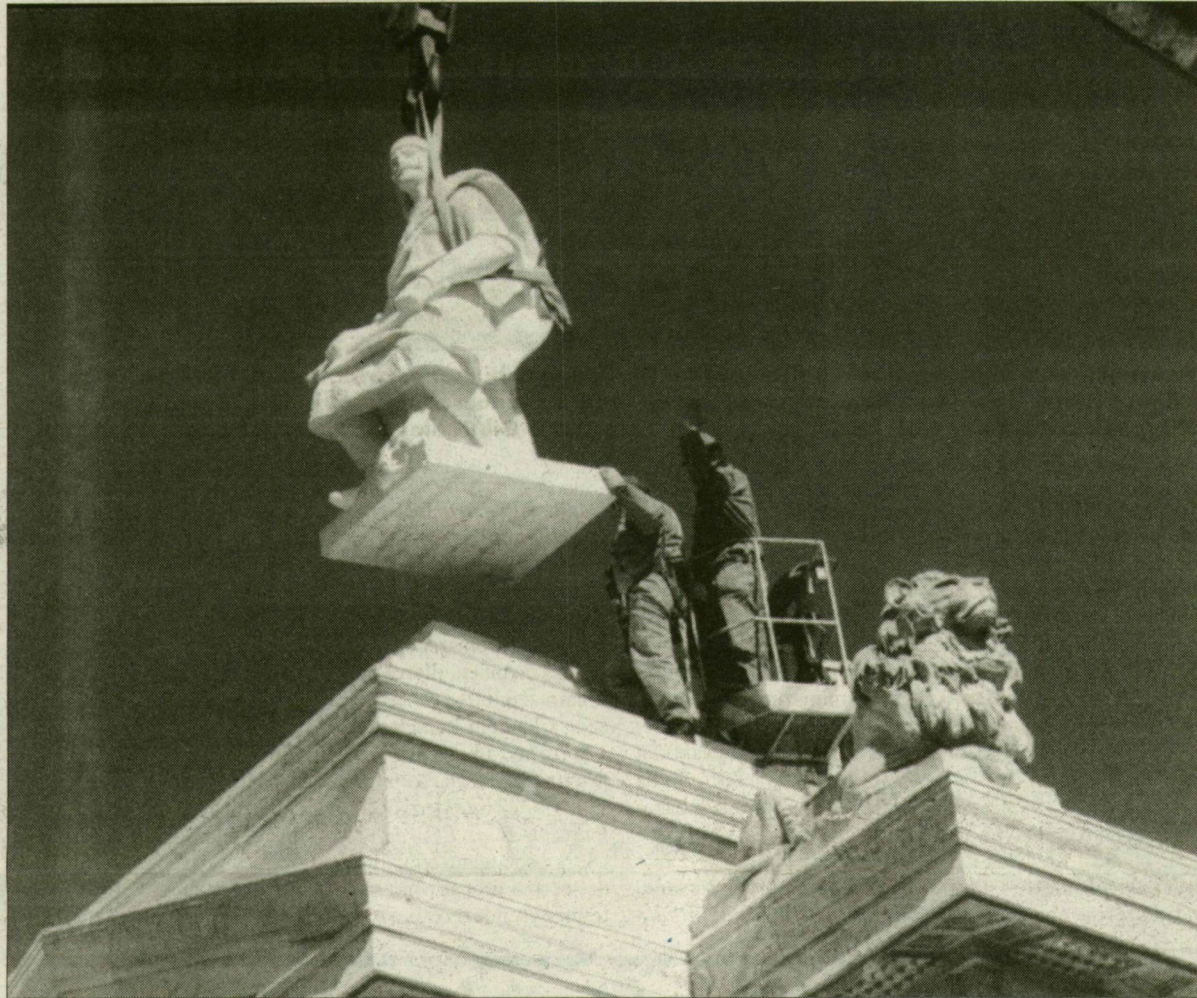
A régi szobor pontos mását tegnap helyezték vissza a talapzatra.

Ezután az 1948-as forradalom emlékére katonadalog hangzanak el, majd Nagy László, az ÖNTE Kht. ügyvezetője köszönti az ünnepség résztvevőit. Az egybegyűlték meghallgathatják Ady Endre: Új tavaszi se-