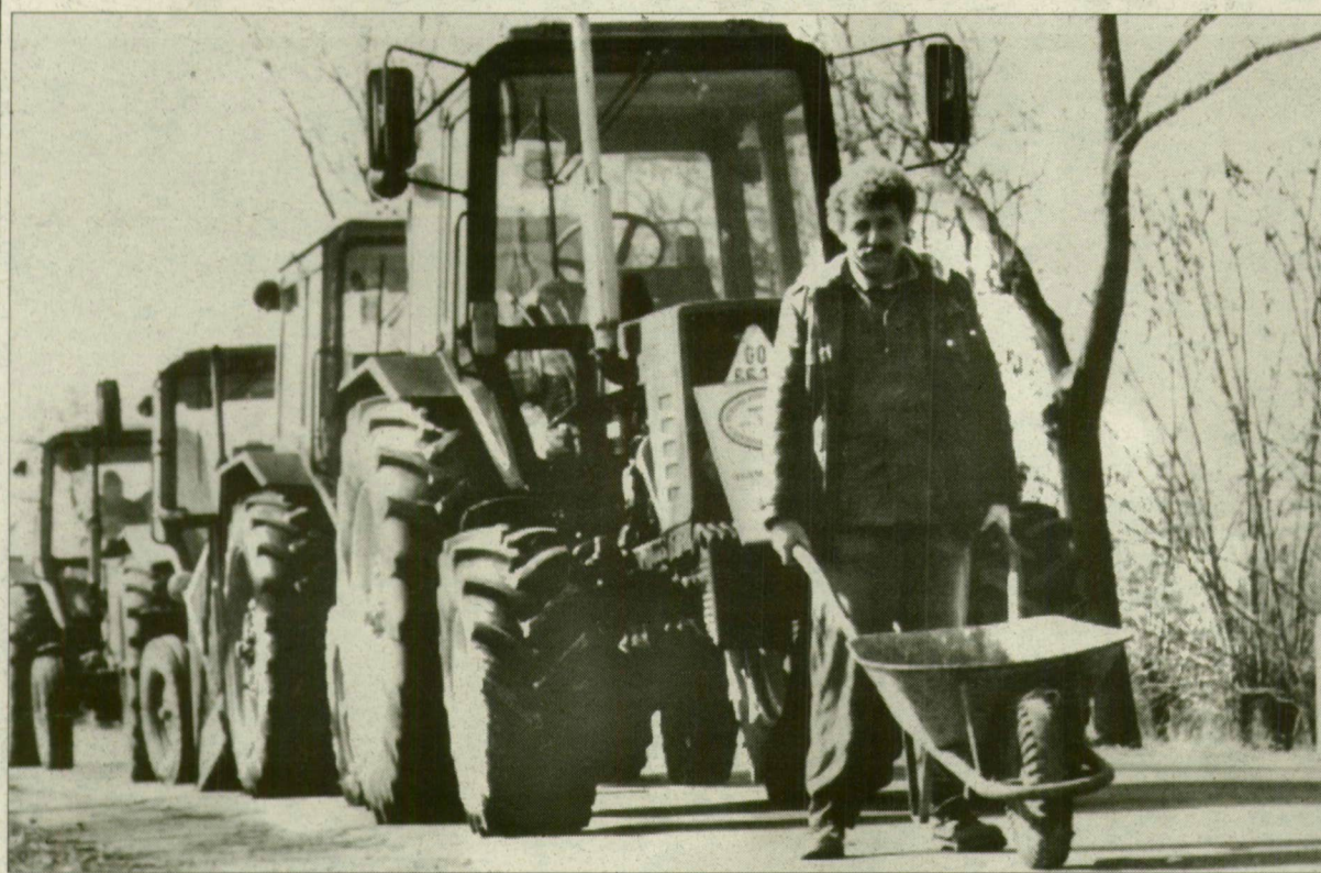
Tüntetés 1997-ben. Magyar ember, magyar úton, magyar traktorral.

A földkérdést ezekben a hónapokban pihenteti a parlament. A következő törvényhozó testület feladata lesz az, hogy tiszta vizet öntsön a pohárba. Hamarosan el kell döntenie, jó-e, ha szövetkezetek, gazdasági társaságok nem vásárolhatnak földtulajdont, s hogy mennyire harmonizál az EU tagállamainak jogalkotási gyakorlatával a jelenleg érvényes földtörvény. A szakemberek már most alkotmányossági aggályokat fogalmazzák meg.