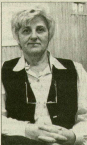
„Humánus közösségekre van szükség.”