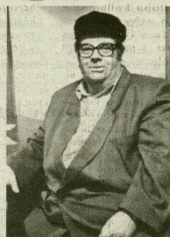
Harminckilenc éve cseréli arcait.

Van-e aki igazán ismeri? Harminckilenc éve cseréli arcait az ő saját világában, a színházban. Kicsoda ő? A tündéri Lumpáciusz Vagabundusz iparos, a szorgos Gyalu? A józan Sancho? A furmányos Figaro? A kópé Balga? Talán Mercutio, az álmok felhőlen lovagja, a virtuskodó, léleteli, vidám ifjú, aki Romeóra várva nagyokat kurjant és pisil egyet a falnál? Az álmaiba-önáltatásaiiba belehaló Ügynök? Vagy a korosodó színész, Kean, akit művészet a társadalmi ranglétra csúcsára repített, aki büszke is erre, mégis örökké bizonytalan, aki egyszerre magabiztos profi és rettenetesen sebezhető? Talán Svejk, a született intelligens? A szánandó Firsza Cseresnyéskertből? Az élet császara Falstaff? A családjáért resz-