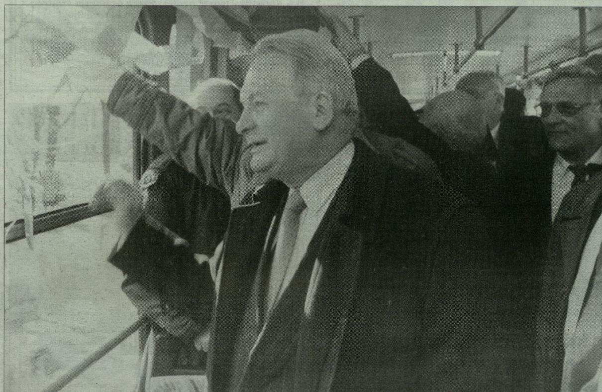
Gál Zoltántól sem kértek jegyet az ellenőrök.

Szombaton forgalomban álltak az új szegedi villamosok. Tizenhárom cseh Tátra váltotta föl az 1-es vonalon három évtizede szolgáló csuklós kocsikat. Az Aradi vértanúk terén megtartott átadási ünnepséget kora délutánig zajló „közlekedési farsang” követte.