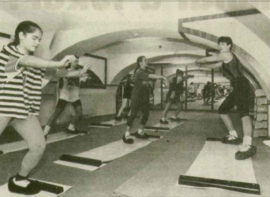
A speciális műanyag szalagon tornázva folyamatosan feszül minden izom...

Hallottak már a slide-ról? Mert ha nem, sürgősen tessék bepötlölni e hiányt, ugyanis a slide (szlajd...) talán már pár hónap alatt oly vehemenciával hódítja meg a fitness-sport követőit, mint tette egykoron a nagymamákat is táncra perdítő aerobic.