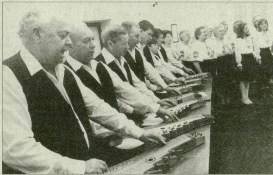
A kisteleki citerazenekar és asszonykórus is nagy sikert aratott Zákányszéken.

vonószekara lépett fel, tánczenekert játszottak különféle korstílusokból. A vonószekara lépett fel, tánczenekert játszottak különféle korstílusokból. A vonószekara lépett fel, tánczenekert játszottak különféle korstílusokból.