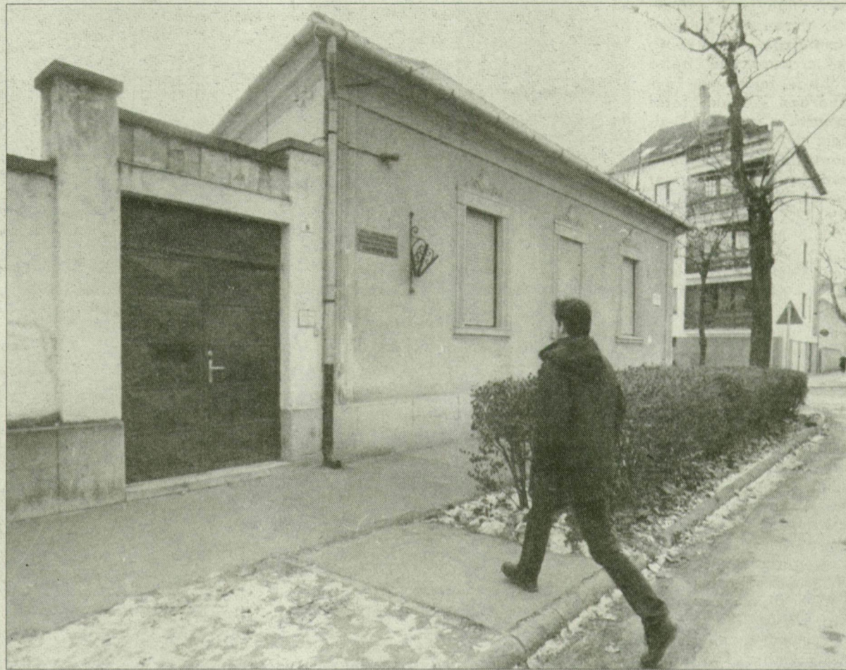
Hétfőn beindul az élet a nemzetiségi házban.

Szombaton nyitották meg Szegeden, az Osztrovszky utca 6. szám alatt a kisebbségek házát, melyben négy nemzetiség kapott helyet. A Négy Szegedi Kisebbségi Önkormányzat Társulása az ingatlant használatra kapta Szeged városától.