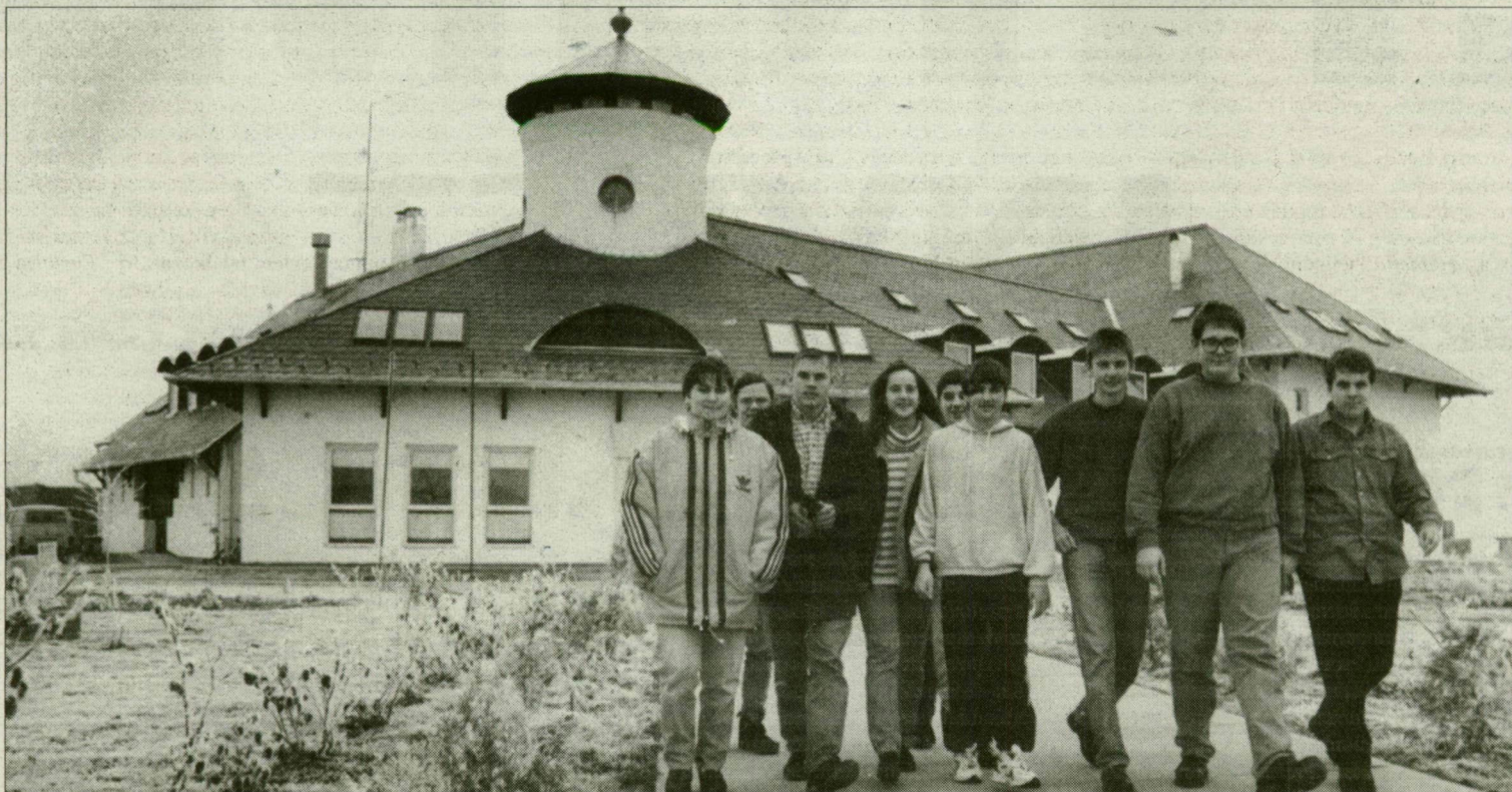
A pusztamérgesi középiskola diákjainak zöme egyben kollégista is.

gimnáziumi osztályokba jelentkezők között tudunk válogatni, a szakiskolába valamennyi érdeklődőt felvettünk. Épül az intézmény következő szárnya, szeptembertől erre szükségünk is lesz, mert egy évfolyammal gyarapodunk. Az idegenforgalmi képzésünk iránt – idegenvezető és hostess felső-