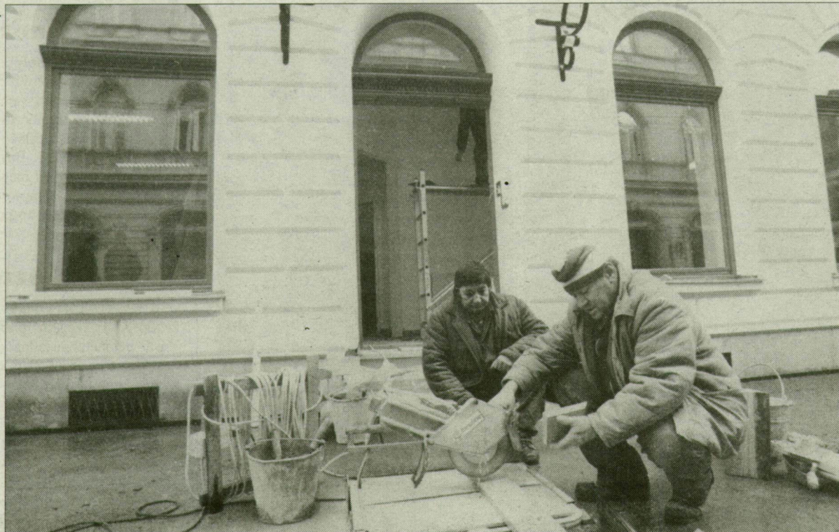
Június 30-ára teljesen megújul a főkonzulátus épülete.

Emil Constantinescu román és Göncz Árpád magyar köztársasági elnök kedden nyitja meg Szegeden Románia magyarországi főkonzulátusát. A külképviselet végleges felújítását június 30-ára fejezi be az Épületkezelő és Fenntartó (ÉKF) Kft.