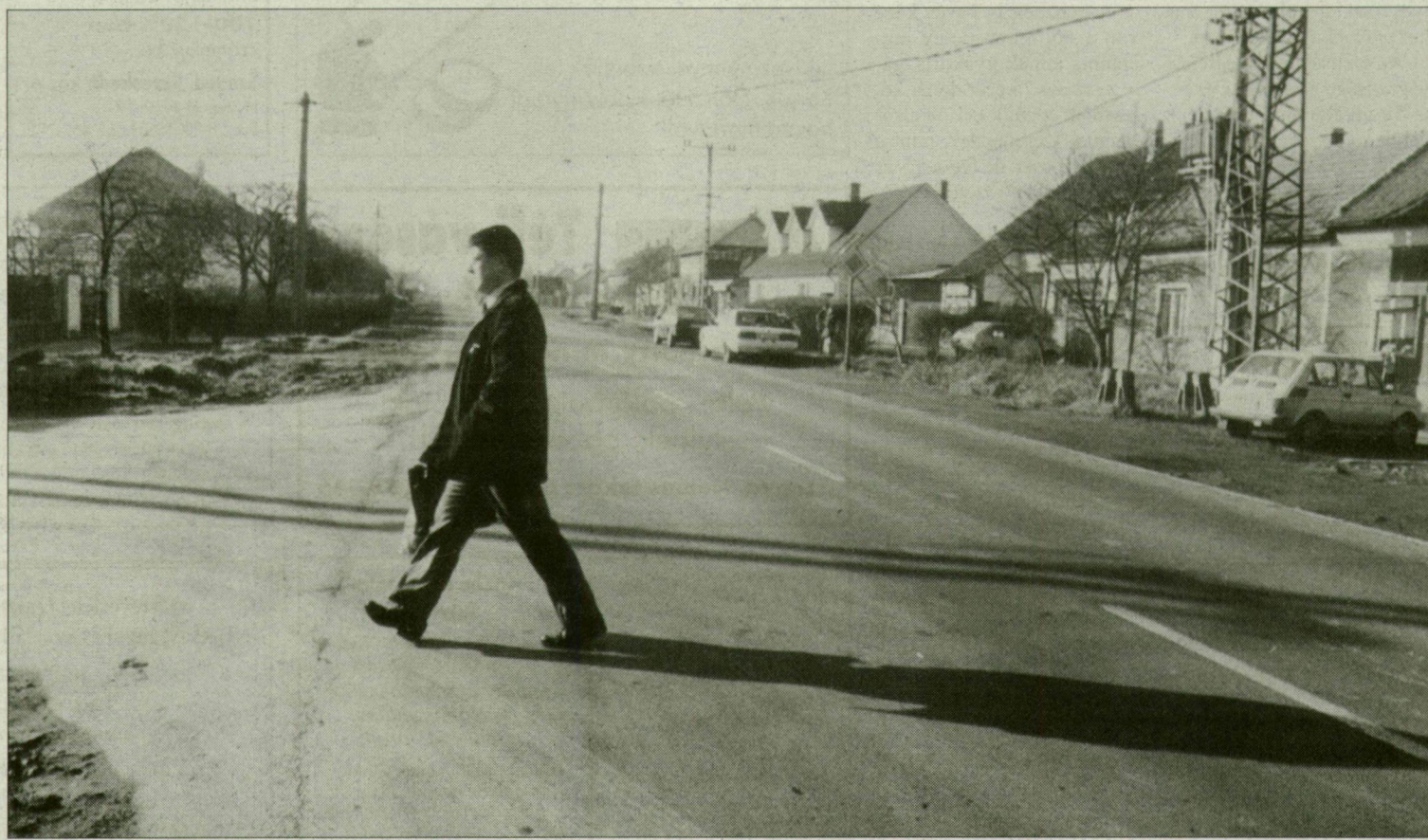
Ritka pillanat: a Szabadkai úton egyetlen kamion sem dübörög a Balkán felé...

– Először is nem ezerszer, csak mondjuk 86 alkalommal csukódik le a vasrúd, már amennyiben személyszállító vonat közeleg. Ugyanis ezen a szakaszon éppen ennyi szerelvény robbog el 24 óra alatt. Ezért is dugták össze a fejüket már több évvel ezelőtt a MÁV, a város, s persze az állam képviselői, azon vitatkozván, hogy alul- vagy fölüljáróval oldják-e meg a kecskési csomópont problémáját? Mert ha valahova Szegeden, hát ide mégiscsak illenék már komolyabb átkelőt építeni. Fölüljáró semmiképp nem