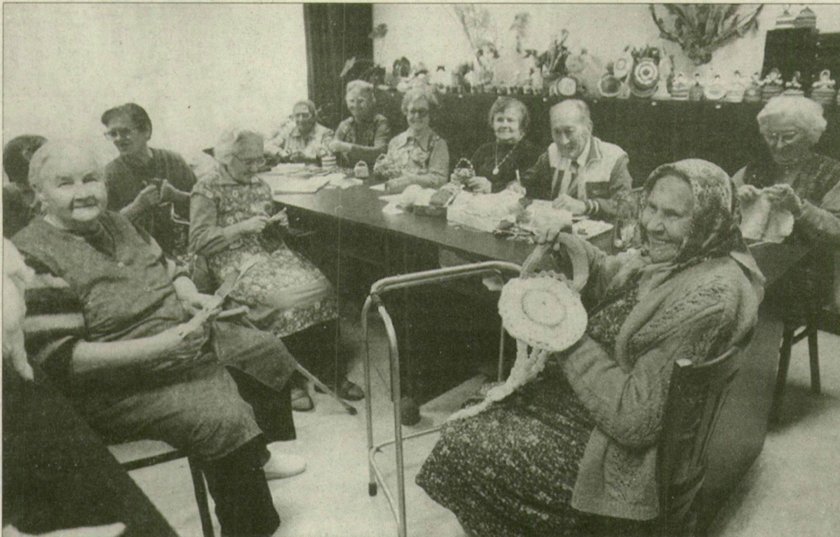
A kellemes környezetben nyugodtan élhetnek az idős emberek.

Napjainkban, amikor egyre gyakrabban látni elhanyagolt, fázó, éhező idős embereket, csak abban reménykedünk, hogy mégis ők vannak kevesebben és nem a jobb körülmények között élő társaik. Igaz, sok nyugdíjas nem is a szomszori anyagiak miatt szomorú, sokkal inkább a magány az, ami nyomasztja őket. Ez utóbbira is gyógyírt jelenthet számukra egy jól felszerelt szociális otthon – mint amilyen a Kisteleki Napsugár Otthon is –, ahol akár saját apartmanban, de nem elhagyatottan élhetnek.