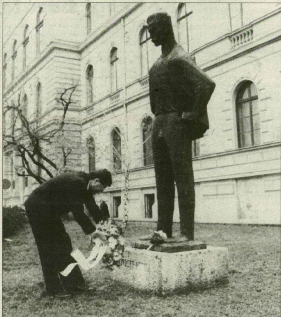
Az egyetem vezetői koszorút helyeztek el József Attila szobránál.