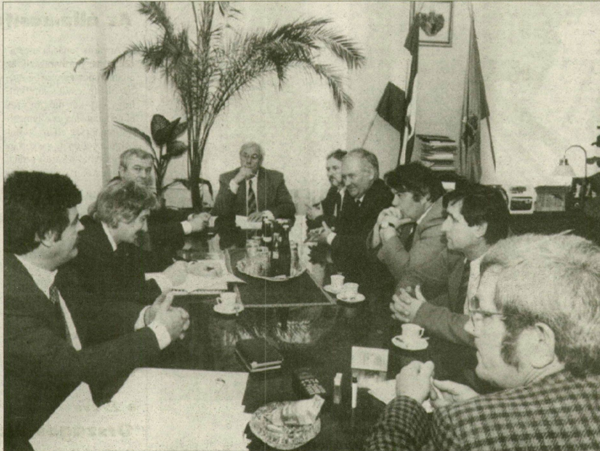
Baja Ferenc miniszter a megye baloldali önkormányzati vezetőivel is találkozott.

Nem a kormány, hanem a polgár csatlakozik az Európai Unióhoz. Vagyis az önkormányzatok nélkül nem lehet sikeres a csatlakozási folyamat. Ezért szeretné közelebb vinni az embereket az integráció ügyéhez a Baloldali Önkormányzati Közösség (BÖK). Az ezt célzó szakmai és tudományos programját a BÖK Szegeden indította a tegnapi, Az Európai Unió csatlakozás esélyei és a területfejlesztés időszaki kérdései című konferenciával. A tanácskozást Lampert Mónika, a BÖK elnöke és Baja Ferenc miniszter, az MSZP-választmány elnöke sajtótájékoztatón értékelte.