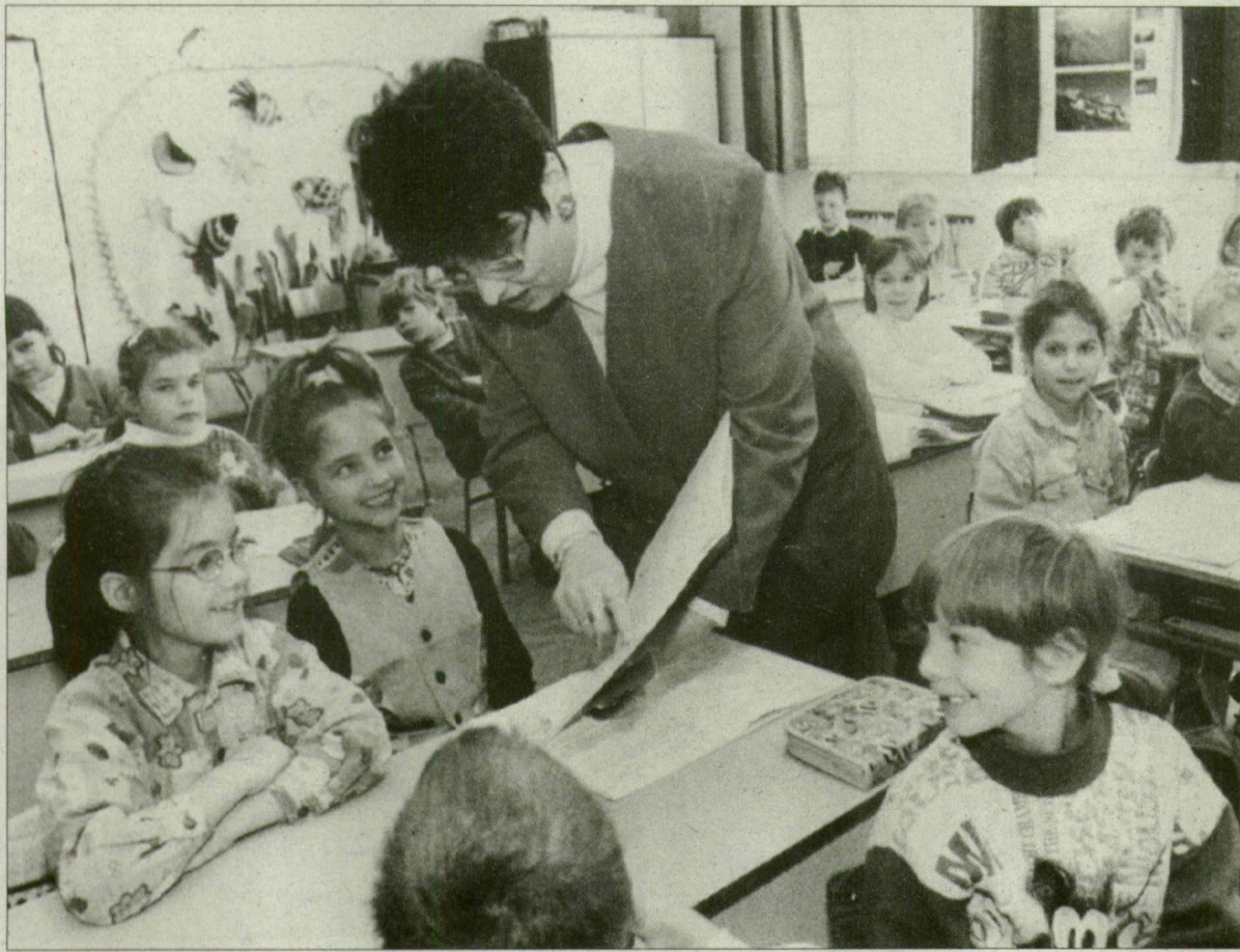
Itt még könyvből dolgoznak, de népszerűek a számítástechnikai programok.

A tanártovábbképzési rendszert övező bizonytalanság ellenére az iskolákban rendben megtörtént a céltámogatás elosztása és a pedagógusok beiratkozása a különböző képzésekre. A tanártovábbképzésben résztvevő szegedi felsőoktatási intézmények közül a Juhász Gyula főiskolán elégedettek a jelentkezők számával, a JATE-n viszont úgy érzik, az egyetemet választó körülből száz pedagógusnál jóval többet tudnának fogadni.