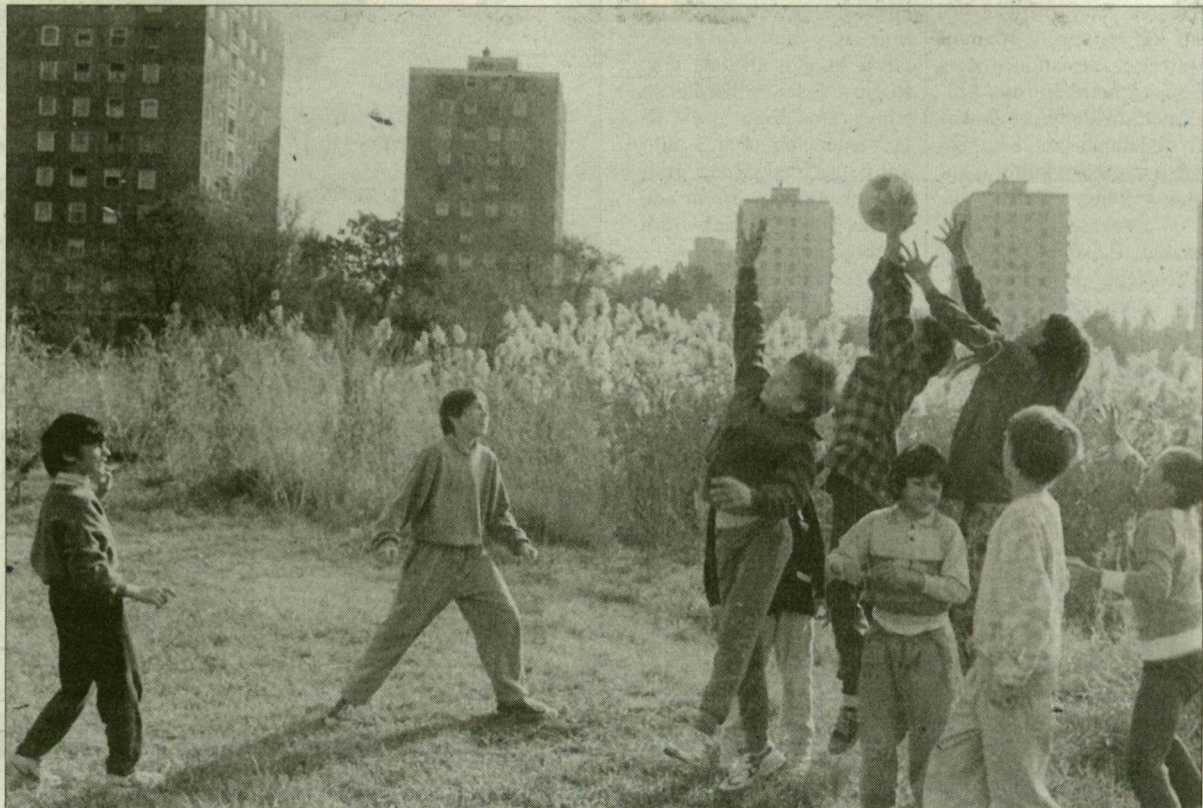
Szemét után pénz húzható a Búvár-tóból?