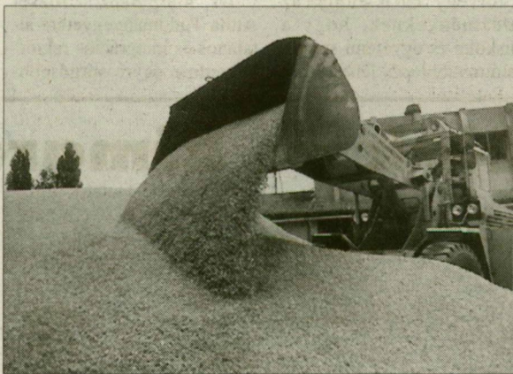
Kenyérgabona, aratáskor. Drágán mérik, holott van belőle elegendő.

és jó minőségű búzatermésel számoltak. A betakarítás is zökkenőmentesen indult. A július 10–20. között bekövetkezett emlékezetes esős időjárás azonban ártott a kenyérgabona minőségének, ugyanis a csírázás már a kalászban elkezdődött. De ez a folyamat mostanra megállt. A B-1-es malmi búza