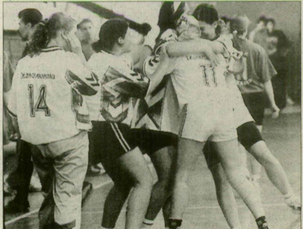
A „délmagyaros” mez szerencsét hozott a Tömörkénynek.