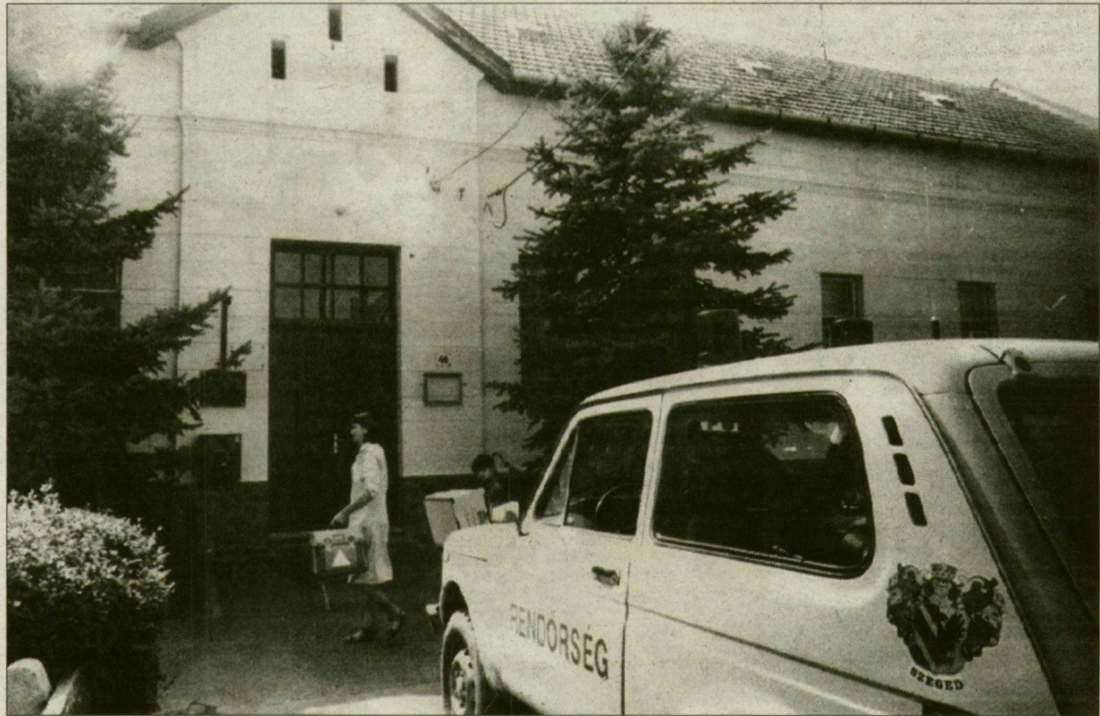
A majdani községháza előtt még szegedi címerrel ékesített rendőrautó parkol.