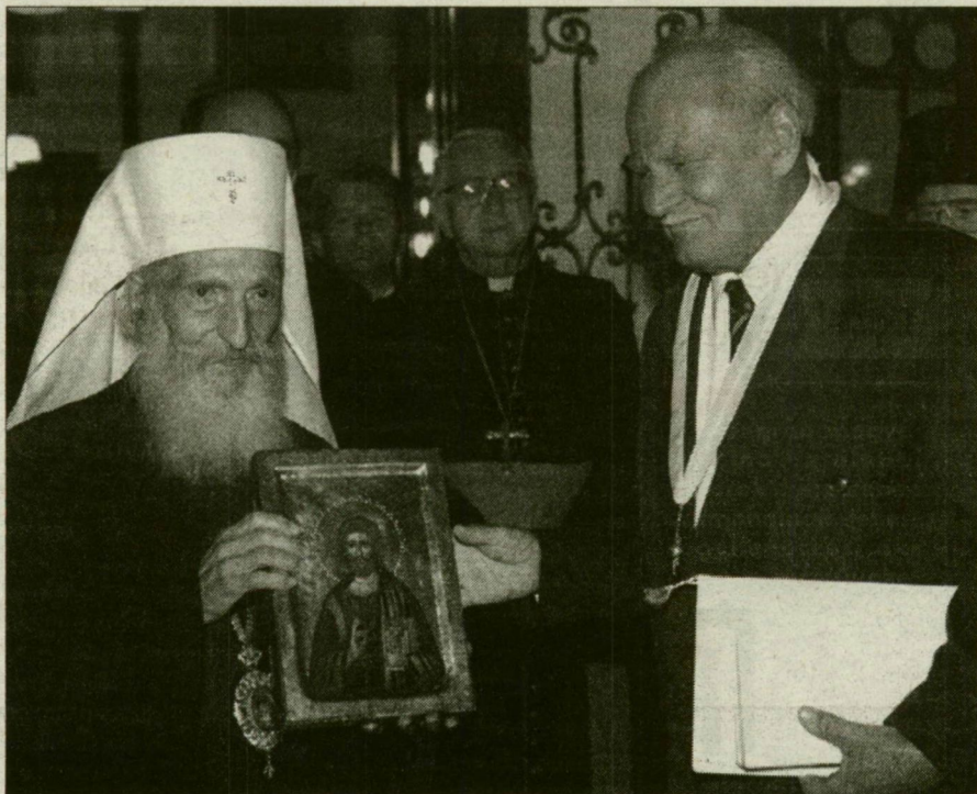
Pál pátriárka és Göncz Árpád – valamint a Szent Száva-kitüntetés.

Göncz Árpád szombaton este részt vett Szentendrén a Budai Szerb Ortodox Egyházmegye meghívására Magyarországon tartózkodó Pál (Pávle) szerb pátriárka tiszteletére a szentendrei püspöki rezidencián rendezett fogadáson. A szerb főpap a köztársasági elnöknek ez alkalomból nyújtotta át a Szent Száva-kitüntetést, a legmagasabb elismerést, amit a Szerb Ortodox Egyház világi személynek adományozhat. Göncz Árpád köszönetében arról szólt: különösen nagy elismerés számára, hogy a szerb egyház megalapítójáról elnevezett kitüntetést kaphatta meg. Az ünnepségen részt vett Paskai László bíboros, prímás, esztergom-budapesti érsek. Öszentsége Pál pátriárka ma este 19 órakor vecsernyén vesz részt Szegeden, a Szent Miklós szerb templomban (Somogyi utca 3.)