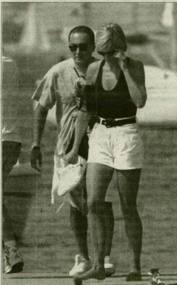
Diana hercegnő és Dodi al-Fajed, a barát, az utastárs...