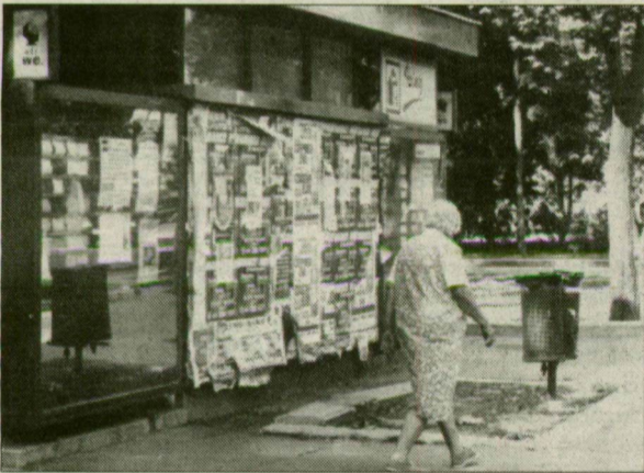
Még hét ehhez hasonló „intézmény” működik városszerte.