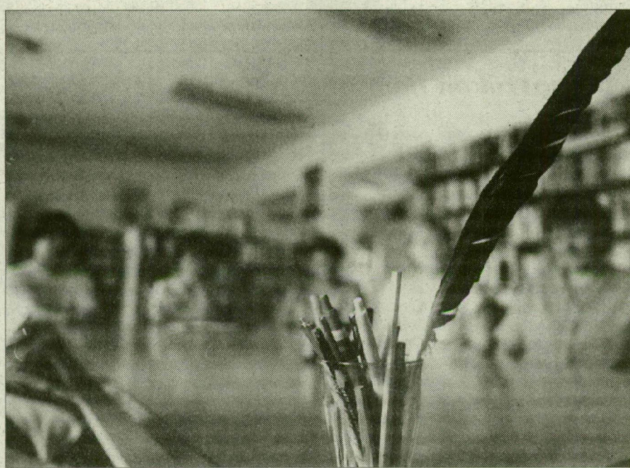
„Arctalan” szülők, akik félnek az esetleges következményektől.

lyét latolgatva, új munkahely után kutatnak. Azonban azok az anyukák és apukák, akiknek nem áll módjukban – másokhoz hasonlóan – kisteleki, szegedi vagy más közeli településen lévő iskolába járatni gyermeküket, szeretnék, ha egy összeszokott, jó pedagógusgárda oktatna az iskolában. Az évenkénti igazgatóváltás, a tanárok egymás közötti viszálykodása viszont éppen ez ellen hat. Igaz – hangsúlyozták jónéhányan –, vannak olyan gondok is az iskolában, amelyeket talán még ilyen körülmények között is lehetne orvosolni. Nem kellene ugyanis a gyenge képességű gyereket nap mint nap azzal megálázni, hogy „a te helyed a kiegészítő iskolában lenne”. Hiszen azoknál a tanároknál, akik szeretettel közelednek feléjük, illetve nem szidással, hanem nagyobb odaadással próbálják velük elsajátítani a tananyagot, tudnak eredményt felmutatni. Ám a tanulók szellemi adottságait, továbbtanulási szándékait figyelembe vevő oktatási módszerek, illetve követelmények alkalmazására tett