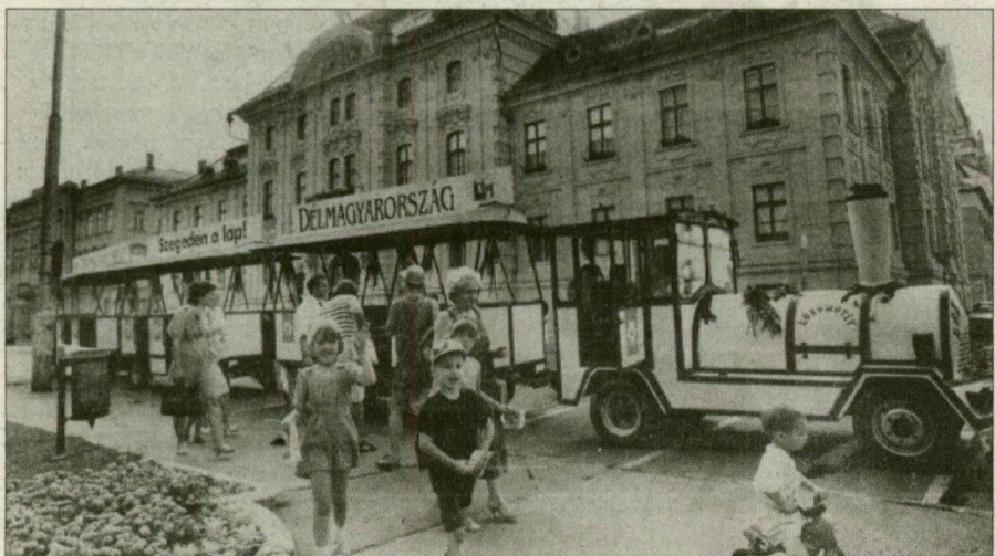
Jön a gözös a virágkiállításról; a Széchenyi téren mindenki beszállhat.