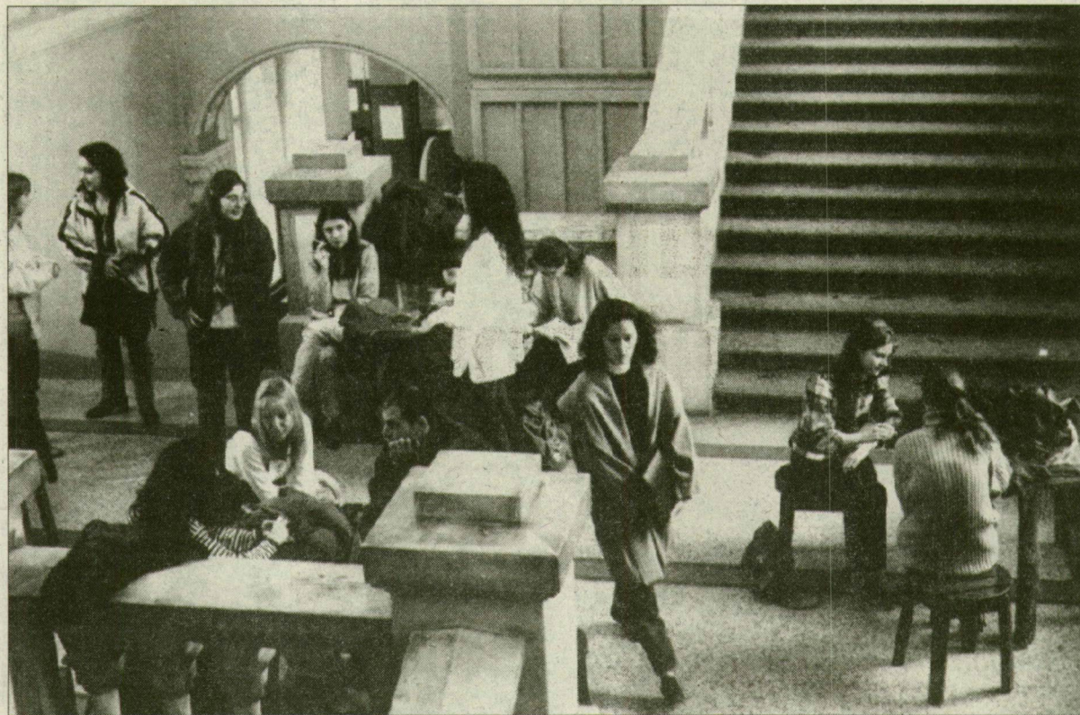
Az egyetemen ígérik, a fizetésőkre ugyanolyan követelmények várnak, mint a többi hallgatóra.

Értékes az egyetemi diploma: ez derül ki abból, hogy a szegedi felsőoktatási intézmények gond nélkül töltötték be azokat a helyeket, amelyeket költségtérítéses fizető hallgatók számára hirdettek meg. Mint alább kiderül, a legnagyobb érdeklődés a gyógyszerészeti, illetve a jogász és közgazdász szakmák költségtérítéses képzése iránt volt.