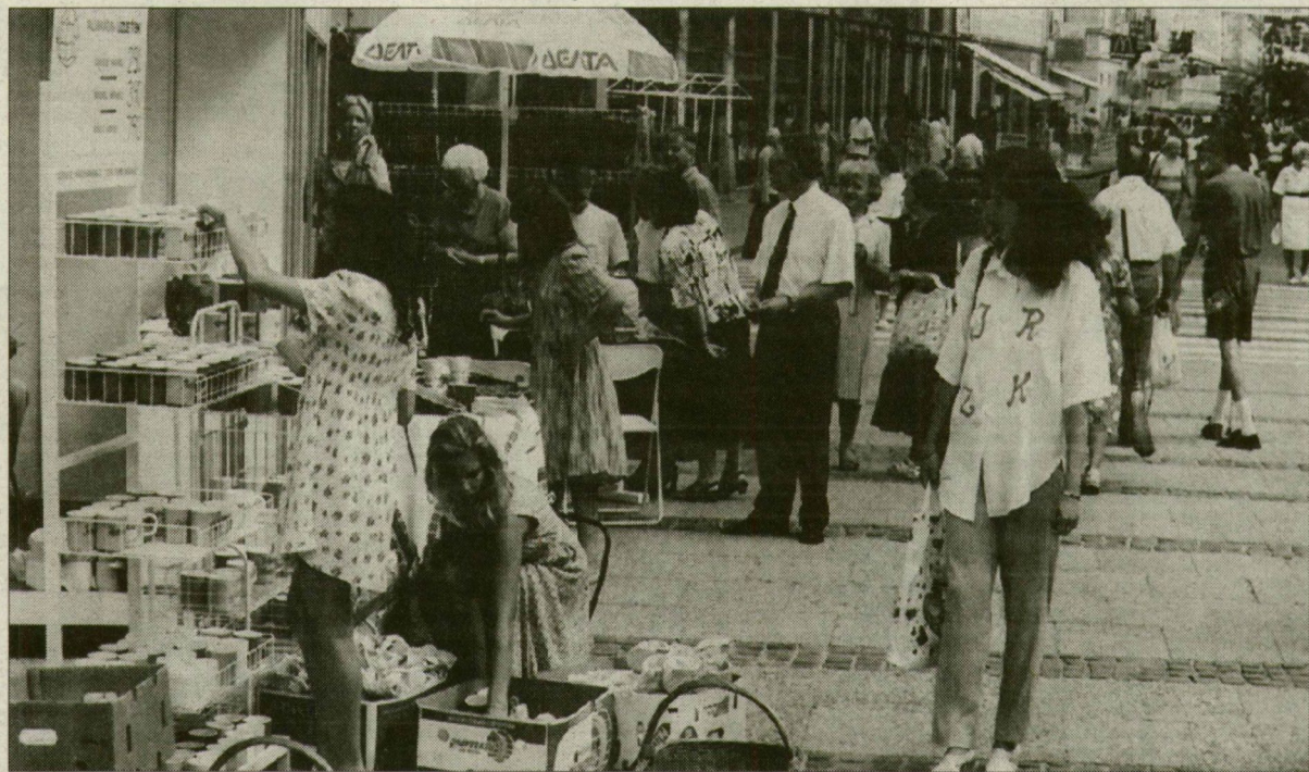
Pakolnak az árusok, kezdődhet a vásár.

Tegnap, szerda délelőtt óta a kézművesek a terep a Dugonics téren. A Csongrád Megyei Kézműves Kamara rendezésében megnyílt az első olyan vásár, amelyből hagyományt szeretnének teremteni a szervezők. A kézművesek kiállítására és a hozzá kapcsolódó programsorozat augusztus 3-án, vasárnap este 7 óráig várja Szeged lakóit.