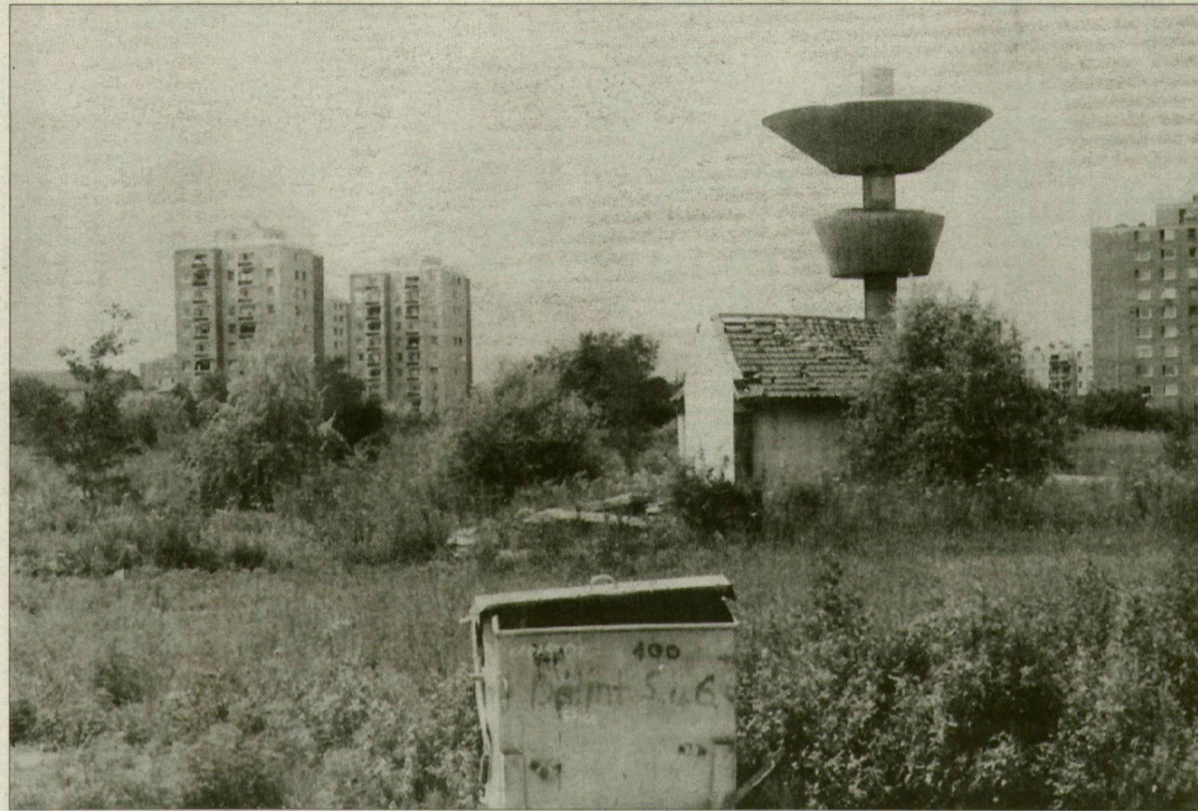
Boldog békeidők. Se áruház, se kamion.

A Tesco Global TH ajánlata eddig a legjobb, amit a város a Francia-högyre kapott. Az összeg valóban rokonszenves. A környék lakói azonban a terület részletes rendezési tervének elfogadását tartanak, azért, mert az nem tartalmazza az eddigi lakossági fórumon elhangzottakat.